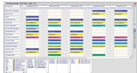
Figuur 1: Planscherm

De software ondersteunt uw bedrijfsprocessen van relatie tot aan de factuur.